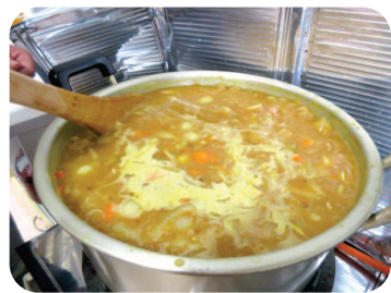
▲おいしいカレーができました