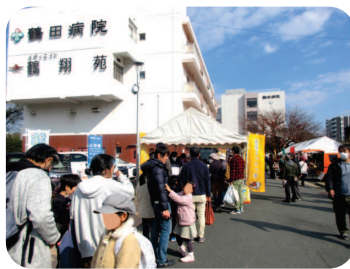
▲テント前には長い列が…！