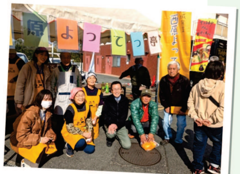
▲ボランティアのみなさんと